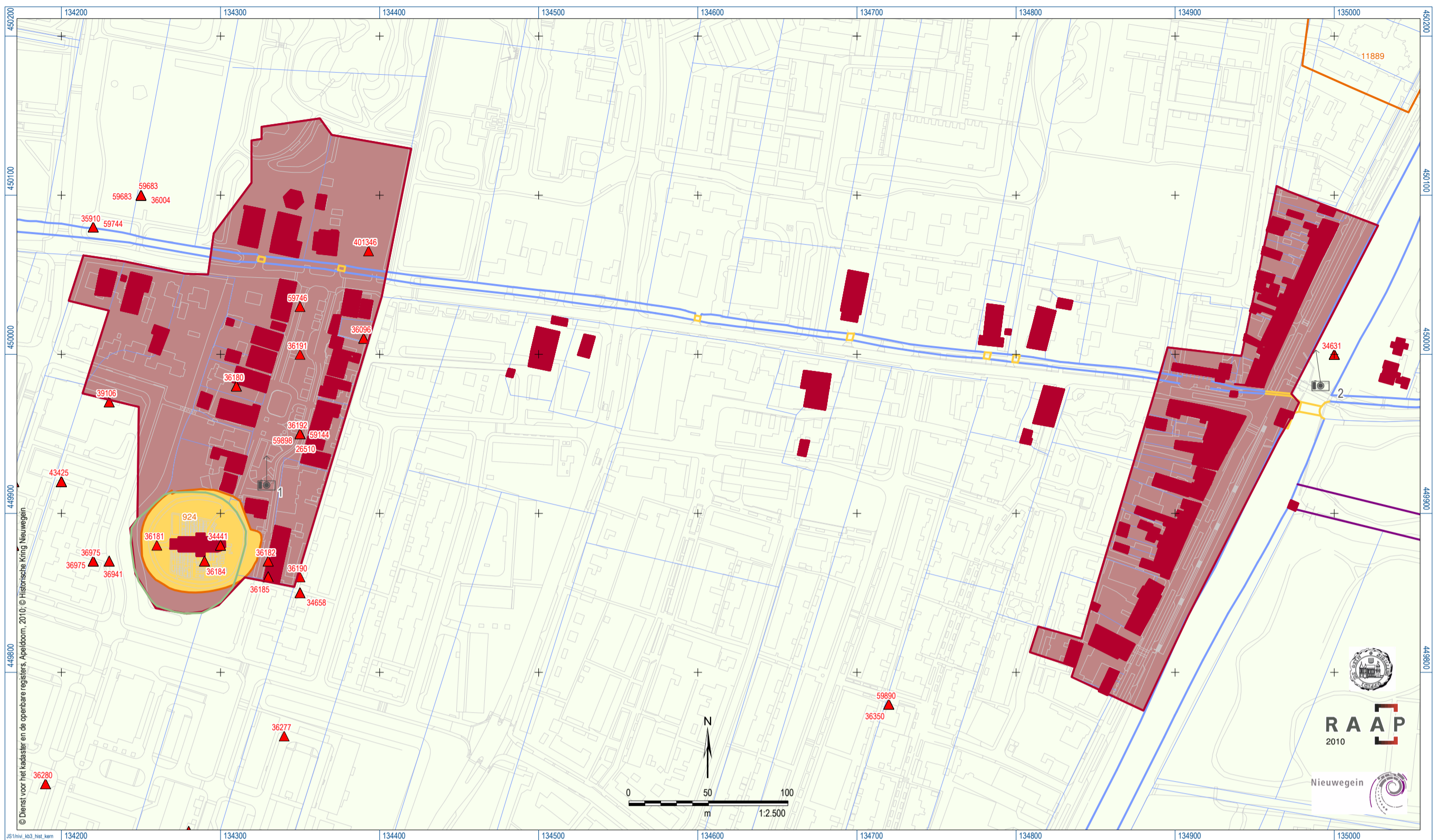
Historische dorpskernen van Jutphaas-Kerkveld.