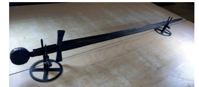
MIDDELEEUWS ZWAARD, OPGEGRAVEN IN 2020