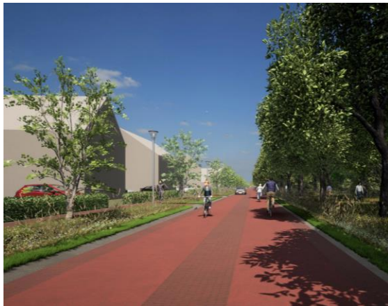
Impressie Laan van Rijnhuizen