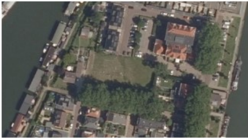
LUCHTFOTO HUIDIGE SITUATIE