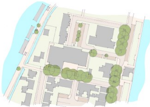
VOORMALIGE SITUATIE PINGUIN