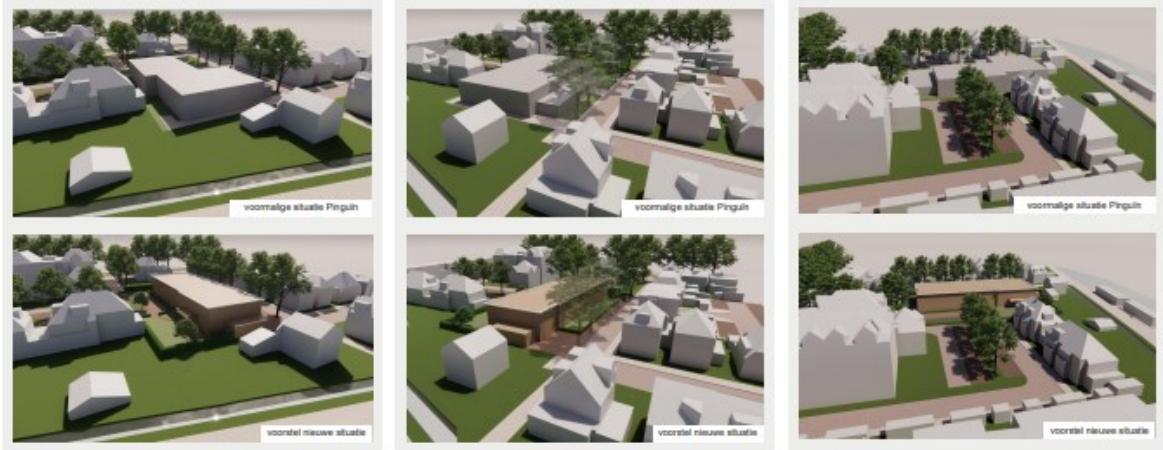
3D VOLUME IMPRESSIES