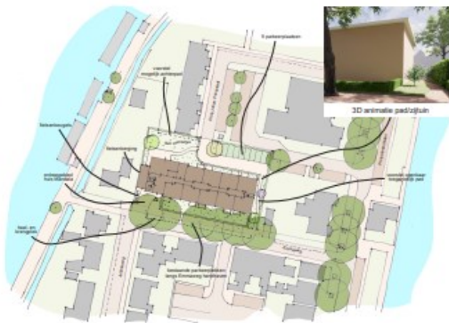
BEOOGDE NIEUWE SITUATIE