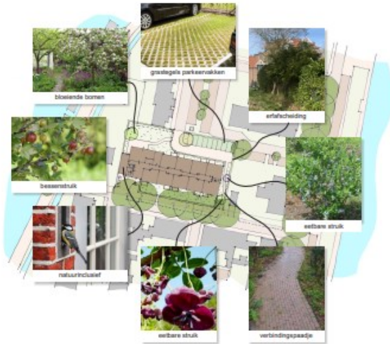
DENKRICHTING BEELDKWALITEIT TEREININRICHTING