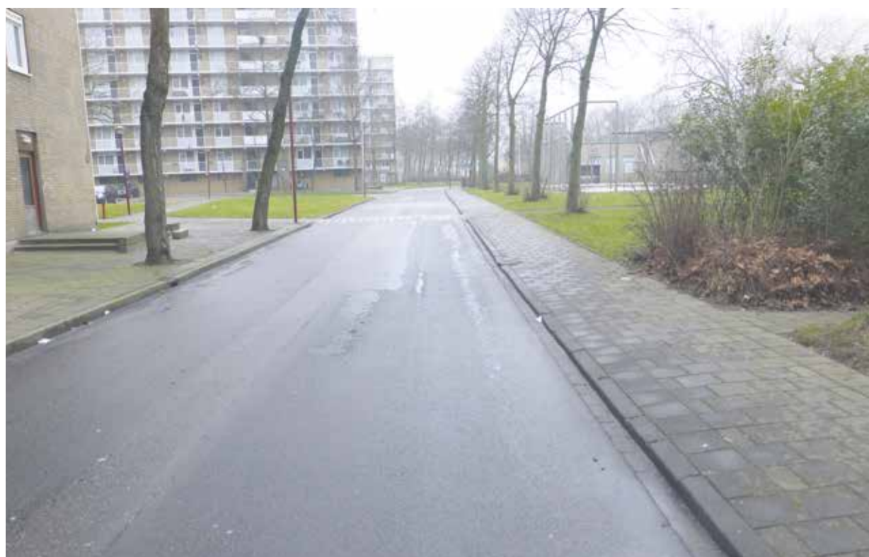
Nypelsplantsoen. De bovenlaag verliest kleine steentjes en er zijn scheuren zichtbaar.