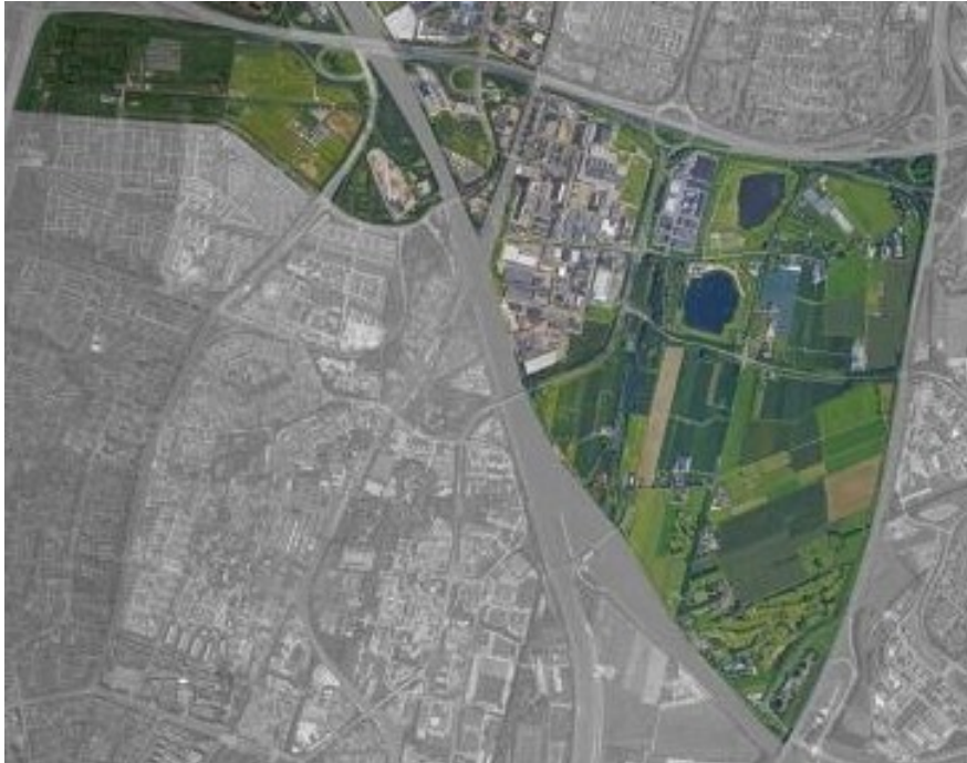
Figuur 2: A-12 zone

Voor de RES 2.0 (2023) of verder wordt nagegaan in hoeverre de A12-zone binnen de geplande ontwikkeling kan bijdragen aan de duurzame elektriciteitsbehoefte van Nieuwegein. Dit in het kader van de permanente zoektocht naar zoekgebieden voor duurzame energie, zoals die verwoord staat in bouwblok 4 van de RES duurzame elektriciteit.